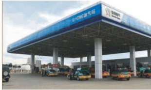
L-CNG加气站 L-CNG filling station