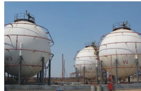
湖北华毅化工有限公司3000m 3 液氨球罐 Hubei Huayi Chemical Co., Ltd 3000m 3 liquid ammonia spherical tank