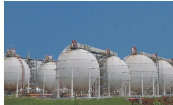
天茂实业集团股份有限公司液化气球罐 Tianmao Industry Group Co. Ltd LPG spherical tank assembly