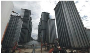
LNG气化站 LNG vaporizing station