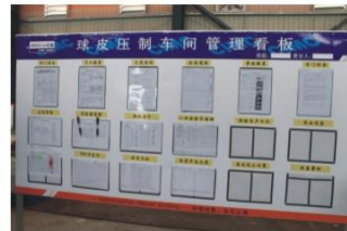
车间规范管理 Standard management of the spherical tank workshop