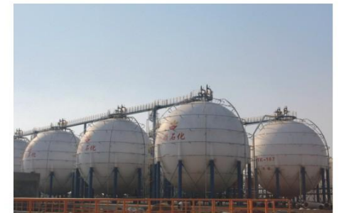
武汉凯顺石化科技有限公司2000m 3 x4LPG球罐 Wuhan Kaishun Petrochemical Co., Ltd. 8000m 3 LPG spherical tank