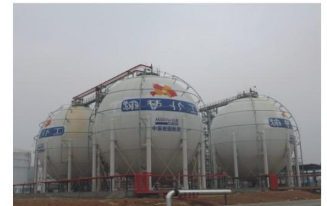
湖北渝楚化工有限公司4x3000m 3 C4球罐 Hubei Yuchu 12000m 3 C4 spherical tank