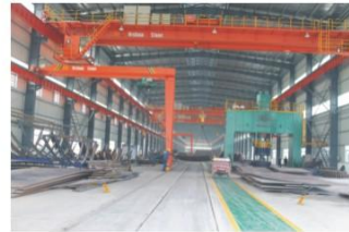
2000吨跨度8米压力机 2000T press machine with a span of 8m