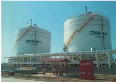
河南濮阳2X5000m 3 LNG储槽(成功案例) Puyang 10000m 3 vat (successful case)