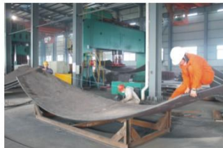
球壳板几何尺寸检测 Spherical tank dimension inspection