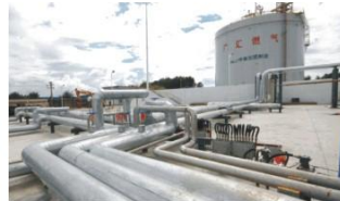
LNG管道 LNG pipeline