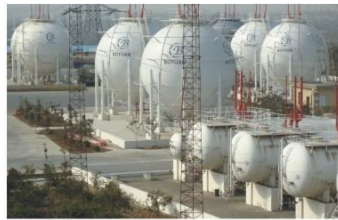
博源实业股份有限公司400m 3 LPG球罐群 Boyuan Industry Co., Ltd 400m 3 LPG spherical tank assembly