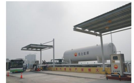
湖北荆门公交公司LNG标准站 LNG Standatd Filling