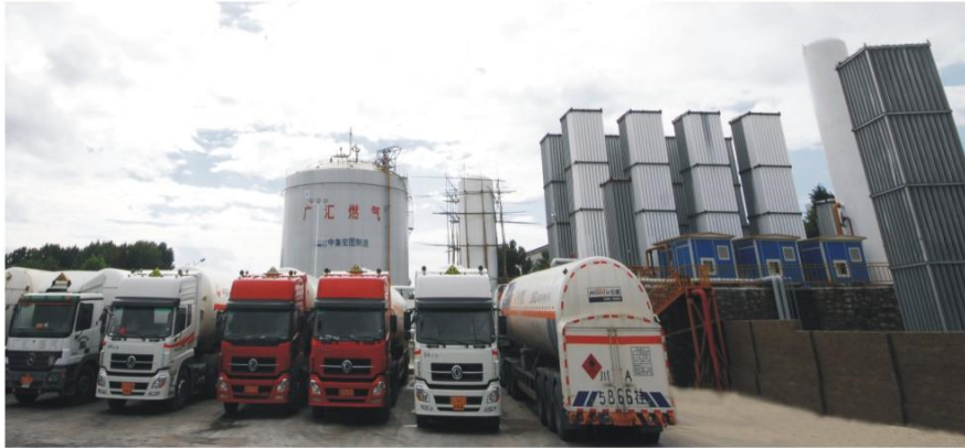
贵州广汇LNG气化站工程项目(2X5000m 3 LNG储槽成功案例) Guizhou Guanghui LNG Gasification Project(10000m 3 vat successful case)

公司建造的大型低温贮槽具有管理科学、技术过硬、建设周期短和优质服务等明显优势，现已成功交付了多项工程项目，获得业界一致好评。