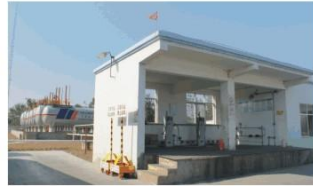
LPG加气站 LPG filling station