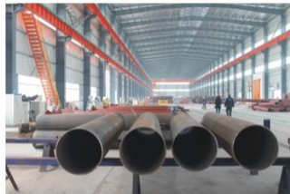
球罐支柱制作 Fabrication of spherical tank stanchions