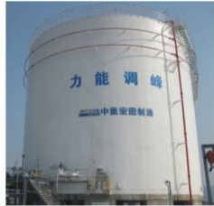
宜昌5000m³大槽工程 (成功案例) Yichang 5000m³ vat (successful case)