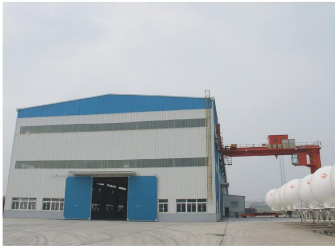
专属球罐制造厂房（外观） Exclusive spherical tank workshop

专业·能力越大，责任越大，始终如一做负责的领先企业 Professional More capacity more responsibility Being the leading conscientious enterprise consistently