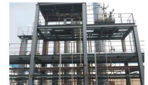
化工工程安装 Chemical engineering installation