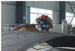
人孔与球壳板组焊 Welding of manholes and tank shell