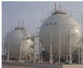
张家界新纪元石化有限公司 1000m 3 液化气球罐 Zhangjiajie New Century Co., Ltd 1000m 3 LPG spherical tank