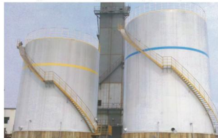
广西来宾1000m 3 液氮储槽、600m 3 液氮储槽(成功案例) Guangxi Laibin 1600m 3 cryogenic vat (successful case)

CIMC Honto takes the advantage of over ten years' experience in cryogenic storage and transportation field and brings in talents to extend the business into cryogenic vat fields. Honto has the ability to provide integral solutions for customers.