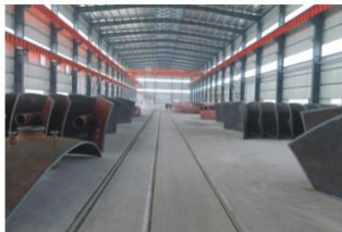
制造完成的球壳板 Completed spherical tank shell