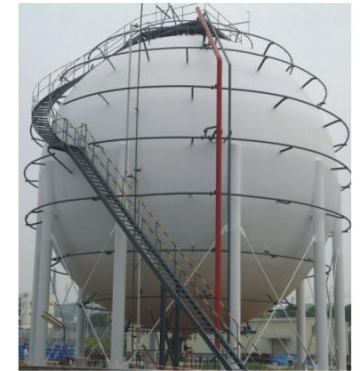
宜昌兴瑞化工有限公司2000m 3 氯甲烷球罐 Yichang Xingrui 2000m 3 chloromethane spherical tank