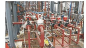
化工管道安装 Chemical pipelines installation