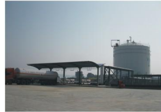
宜昌力能5000m³LNG储罐及装车系统 (成功案例) Yichang Lineng 5000m³ vat (successful case)