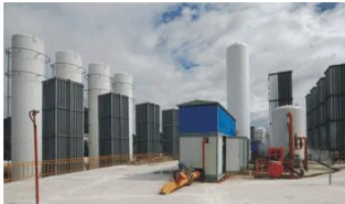
LNG调峰站 LNG regulator station