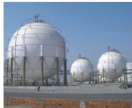
河南龙润科技有限公司 3000m 3 碳四球罐 Henan Longrun Technology Co., Ltd 3000m 3 C4 spherical tank