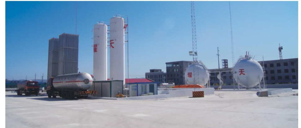
CNG供气站 CNG supplying station

Recent years, Honto provides engineering service such as petrochemical, fine chemical engineering and other fields taking the advantage of the equipment manufacturing to satisfy the requirements of different customers.