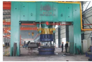
球壳板压制 Spherical tank shell pressing