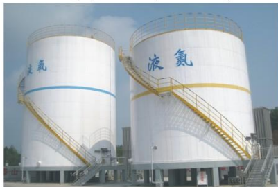
湖北谷城1000m 3 液氮储槽、500m 3 液氮储槽(成功案例) Hubei Gucheng 1500m 3 vat (successful case)