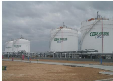
陕西众源绿能4X5000m 3 储槽(成功案例) Shanxi Zhongyuan Green Energy 20000m 3 cryogenic vat (successful case)