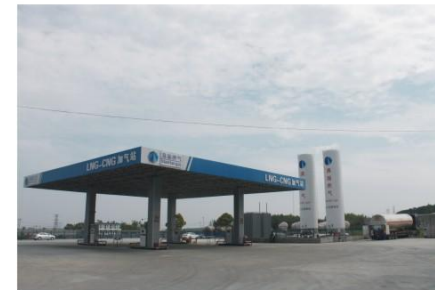
荆门满瀚LNG-CNG混合加气站 Jinmen Manhan LNG-CNGfilling Station