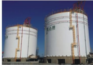
盐池2X5000m³LNG储罐 (成功案例) Yanchi 10000m³ vat (successful case)