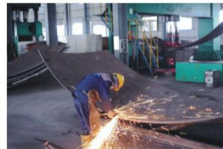
球壳板坡口加工 Grooving grinding