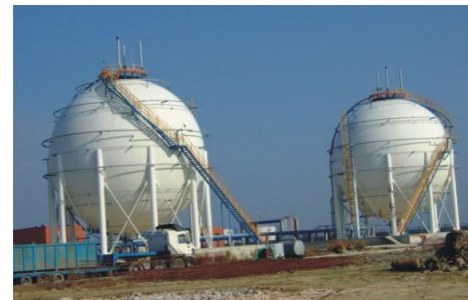
钦州天恒石化有限公司2000m 3 LPG球罐 Qinzhou Tianheng Petrochemical Co., Ltd. 2000m 3 LPG spherical tank