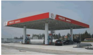
CNG加气站 CNG filling station